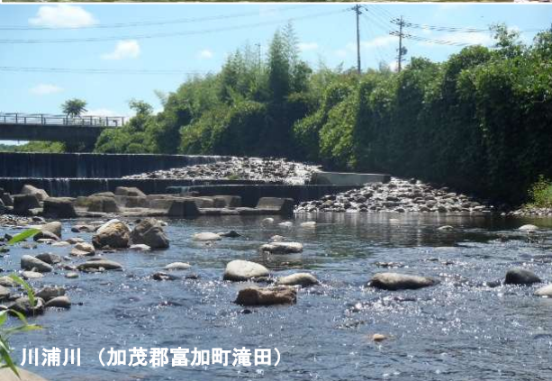
川浦川（加茂郡富加町滝田）