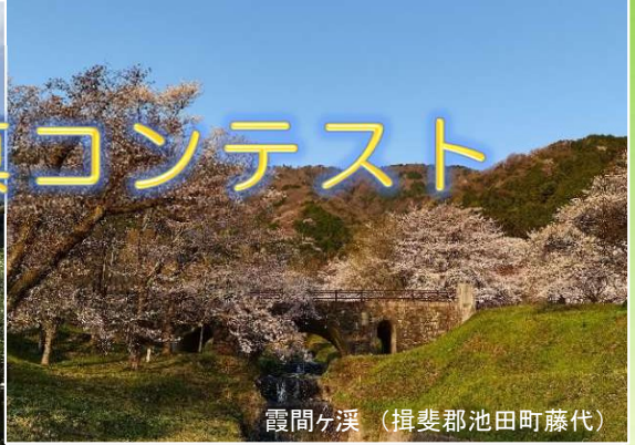
霞間分溪（揖斐郡池田町藤代）