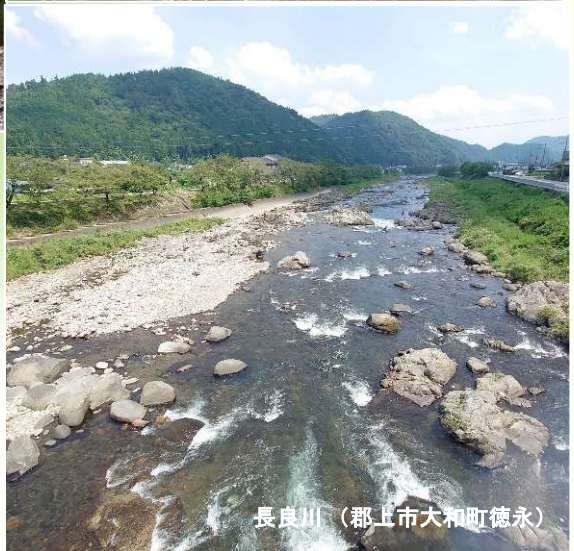
長良川（郡上市大和町徳永）