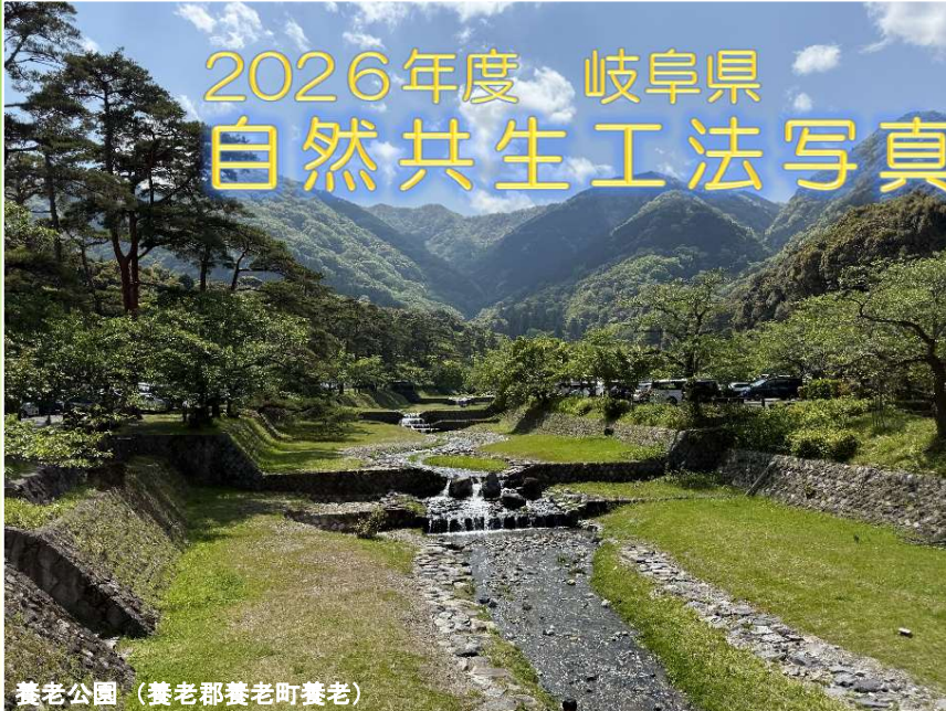
養老公園（養老郡養老町養老）