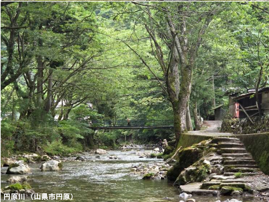
円原川（山県市円原）