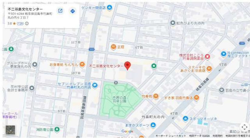
岐阜県羽島市竹鼻町丸の内6丁目7